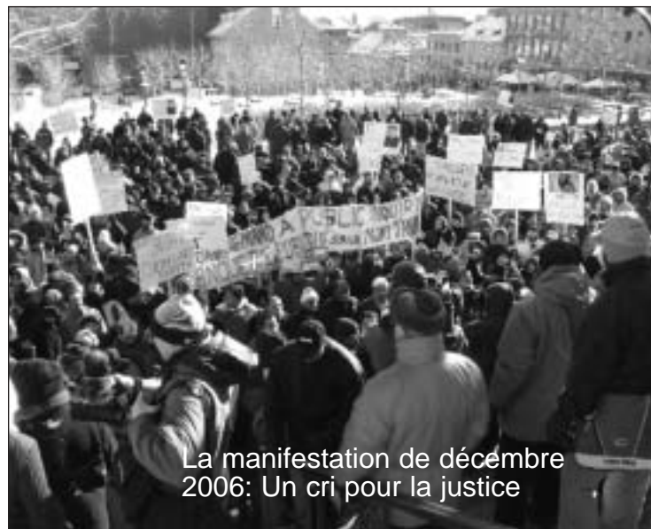
La manifestation de décembre 2006: Un cri pour la justice

à clarifier et qu'«on» ne veut absolument pas clarifier ... Mais grande est la déception d'une opinion publique communautaire fragile et vulnérable qui pourrait même perdre la confiance qu'elle accorde à ceux qui nous gouvernent et qui ont la charge de protéger notre citoyenneté et de garantir nos droits et libertés. Ceci sans parler du cynisme de l'administration qui n'a pas manqué