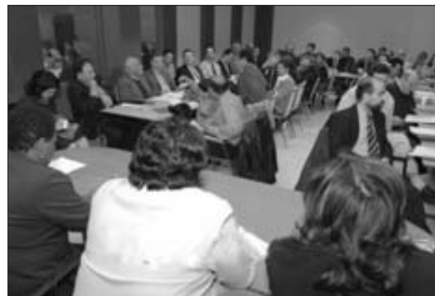
Vue de l'assistance

MONSIEUR GILLES DUCEPPE, chef du Bloc Québécois devait rencontrer les membres de la communauté arabo-musulmane de Montréal le jeudi 27 avril écoulé. Retenu à Ottawa pour l'examen du texte légal devant régir l'accord canado-américain sur la solution du conflit du bois d'œuvre, il a délégué pour ce faire les députées Meili Faille, Maria Mourani et Viviane Barbot afin de poursuivre la politique du Bloc « d'intensifier les contacts sur des sujets qui concernent notre avenir collectif » démarche nécessaire dans la mesure où « le Bloc Québécois souhaite continuer à être le défenseur à Ottawa, des préoccupations particulières de la communauté arabo-musulmane ». L'objet de la rencontre était ainsi de « mettre sur pied un mécanisme formel pour faciliter le dialogue et les échanges » et d'explorer plus à fonds des projets pour favoriser une meilleure participation des citoyens et citoyennes des communautés arabo-musulmanes à la vie politique, sociale et économique du Québec.